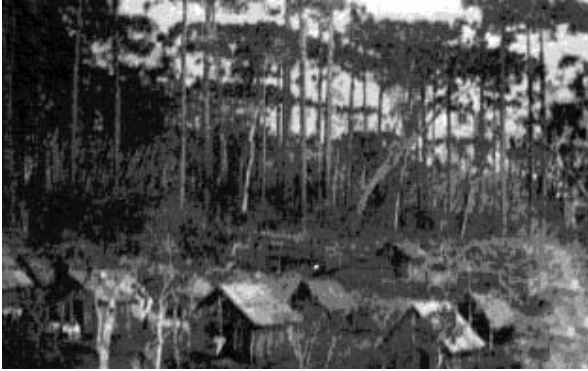
Vista parcial de um reduto.

Esta organização foi imposta por José Maria, desde os primeiros dias do ajuntamento que se formou em Taquaruçu.