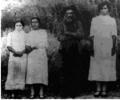
Foto do Monge José Maria acompanhado de três virgens.